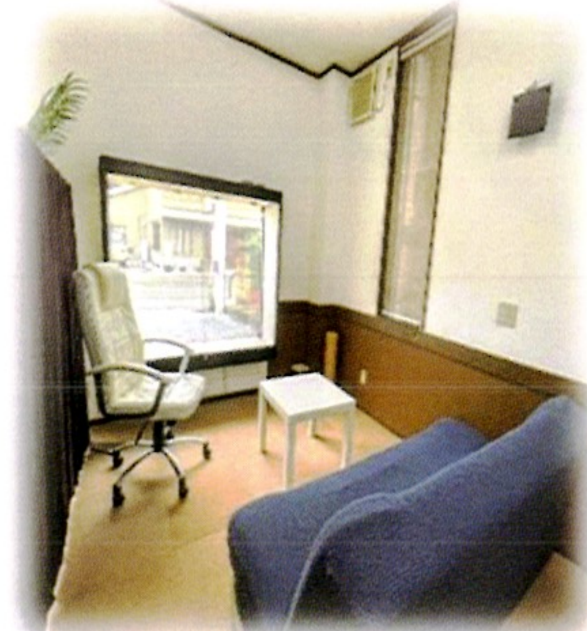
送迎車(目立たなく)